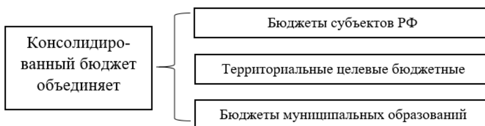
Рисунок 3. Консолидированный бюджет