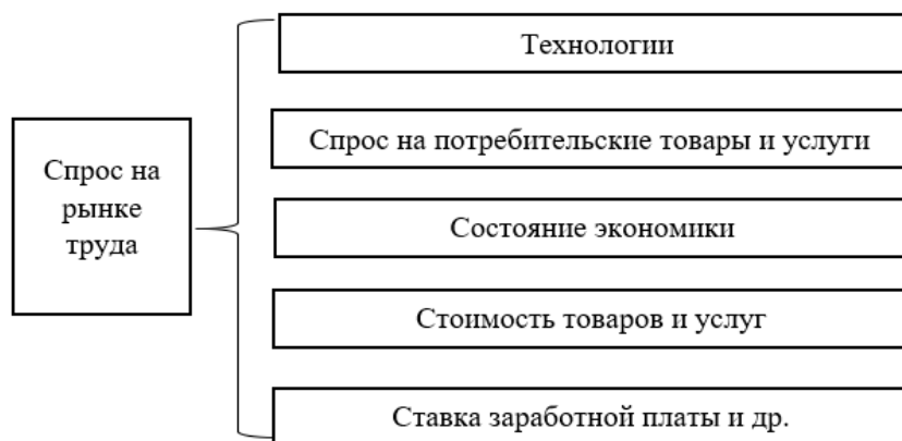
Рисунок 1. Факторы спроса на рынке труда

Разберем подробнее данные факторы. Под технологиями понимается, мобилизовано ли рабочее место. Необходимо определить, в каком количестве работников вы нуждаетесь. В данном