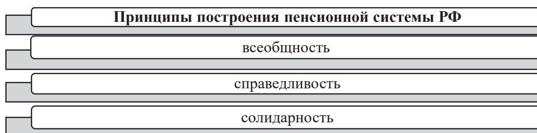
Рисунок 2. Основные принципы построения пенсионной системы в РФ

Третья категория поправок принятая в Конституцию РФ является установление государственных ценностей. Первой государственной ценностью является непосредственно институт семьи. В соответствии с ч. 1 п. Ж1 ст. 72 со стороны государства гарантируется защита детства, материнства и отцовства, кроме того, гаранти-