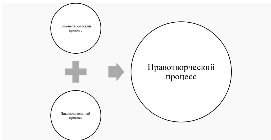
Рис. 1. Составные части правотворческого процесса

В юридической литературе «идея законопроекта» порой неосновательно отождествляется с его концепцией. В действительности концепция законопроекта имеет принципиально иные