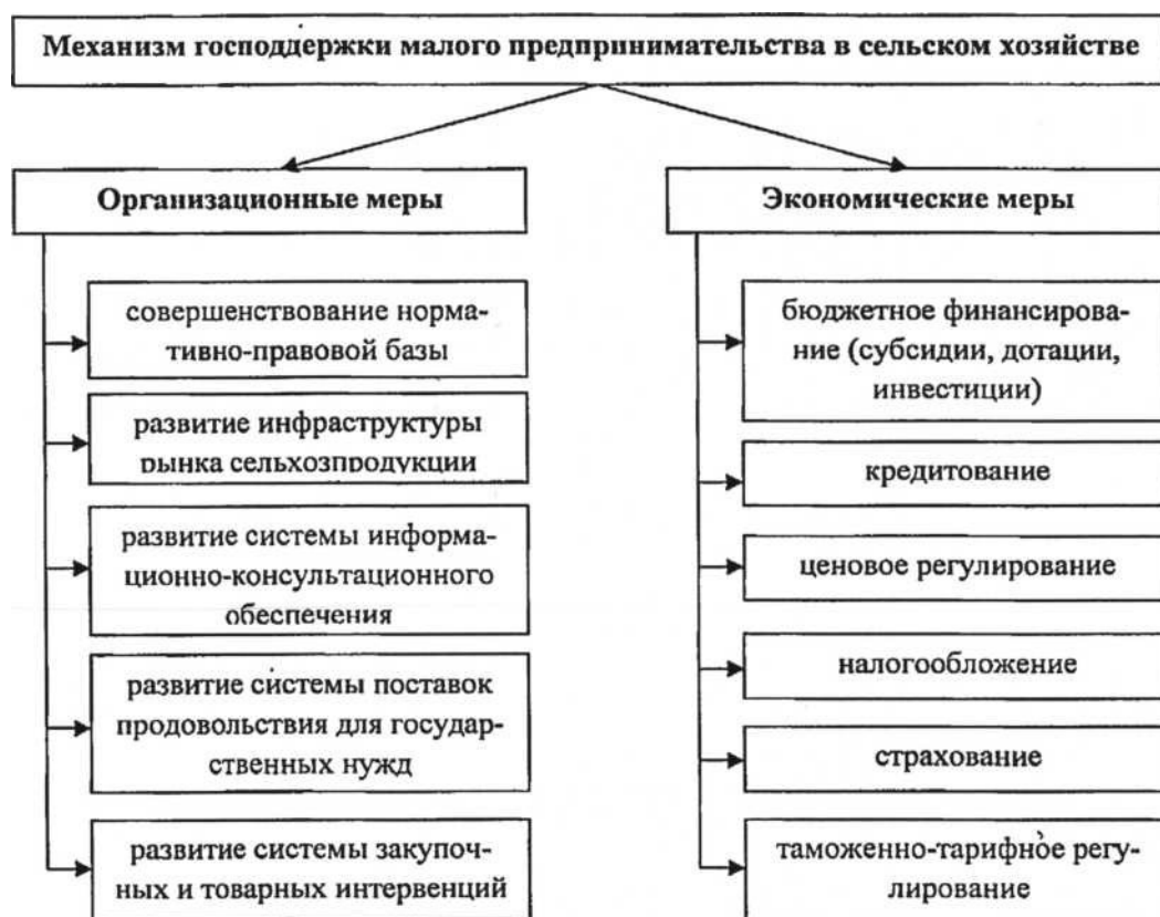
Рис. 2. Механизм господдержки малого бизнеса в АПК