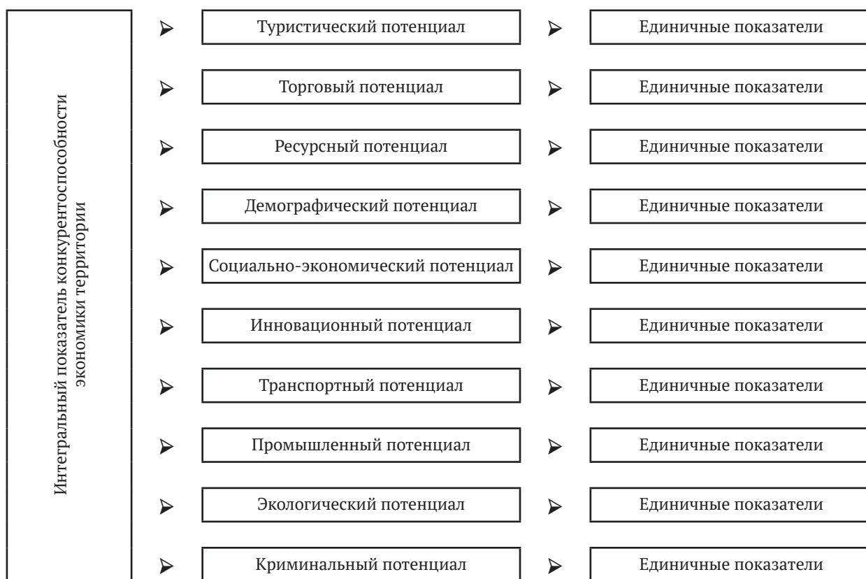
Рис. 2. Система показателей для расчета интегрального показателя конкурентоспособности экономики территории