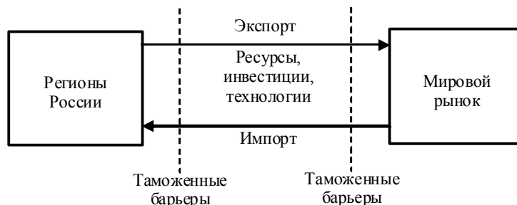
Рис. 1. Модель внешнеэкономической деятельности региона

Для обеспечения эффективного развития трансграничного сотрудничества и распространения объемов и направлений внешнеэкономической деятельности предприятий региона необходимо определить и внедрить наиболее полезный практический опыт создания и функционирования еврорегионов. Важным также является определение стратегических приоритетов развития трансграничного сотрудничества региона, его направлений и степени интегрированности в общую стратегию развития внешнеэкономической деятельности в стране. Изменение модели внешнеэкономической деятельности региона в условиях участия в ЕврАзЭС можно проследить на рис. 1, 2.