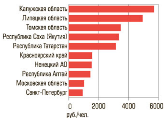
Рис. 1. Топ-10 регионов по размерам институтов развития на душу населения

1. Объем средств, которыми располагали институты развития регионального уровня на начало 2010 г., составлял порядка 83,25 млрд руб. При этом около 41 % совокупных средств институтов развития приходится на девять регионов-лидеров: Татарию, Московскую, Липецкую, Калужскую, Томскую области, Москву, Санкт-Петербург, Красноярский край и Якутию. Важно при этом отметить разницу между абсолютными и относительными показателями концентрации ресурсов институтов развития в российских регионах. Если по абсолютным размерам доли привлеченных ресурсов институтов развития на первом месте среди регионов Татарстан, то по доле от валового регионального продукта за 2008 г. и среднему показателю (сумма средств институтов развития, привлеченных в регион, к населению региона) лидерами списка стали Калужская и Липецкая области, занимающие, соответственно, 3-е и 4-е места при валовом ранжировании (рис. 1). Рокировка объясняется со-