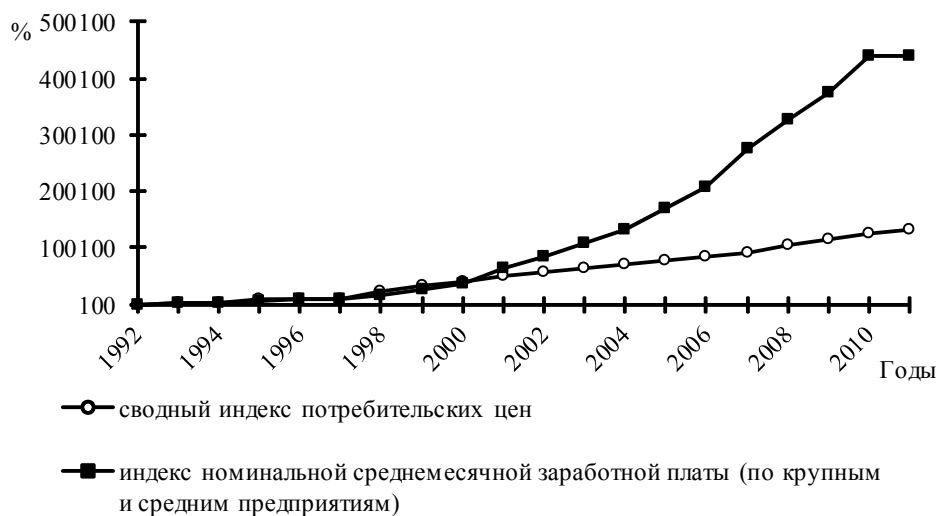
Рис. 1. Динамика сводного индекса потребительских цен и индекса среднемесячной заработной платы в 1993-2011 гг. (декабрь, % к декабрю 1992 г.)