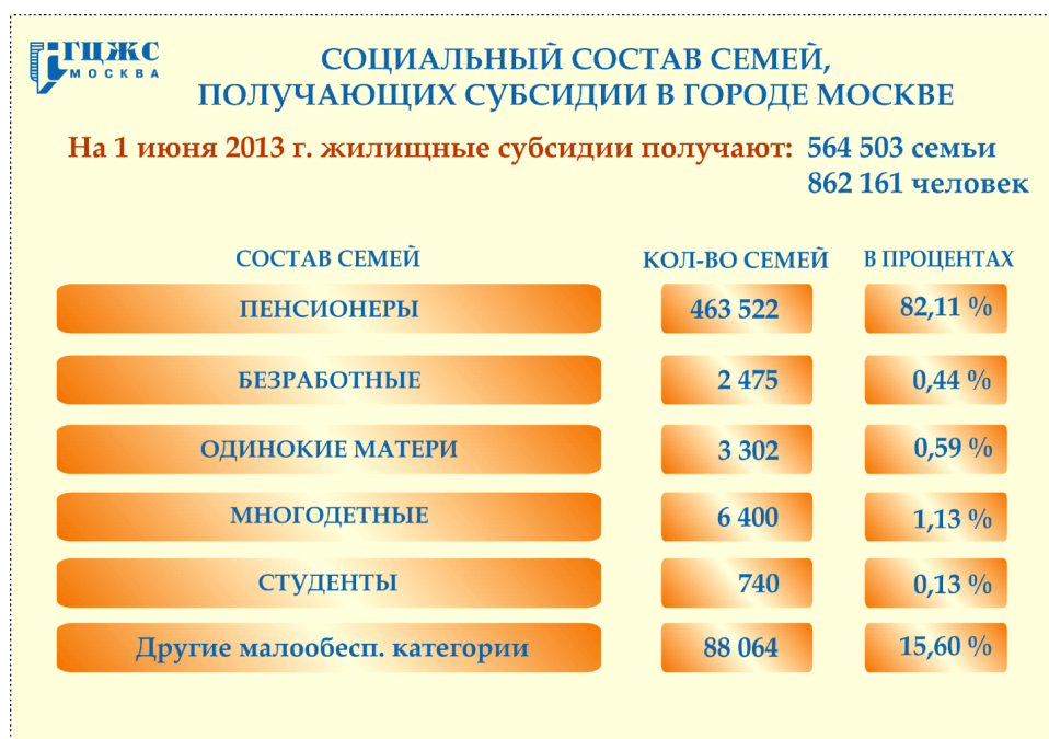
Рис. 4. Социальный состав семей, получающих субсидии в г. Москве