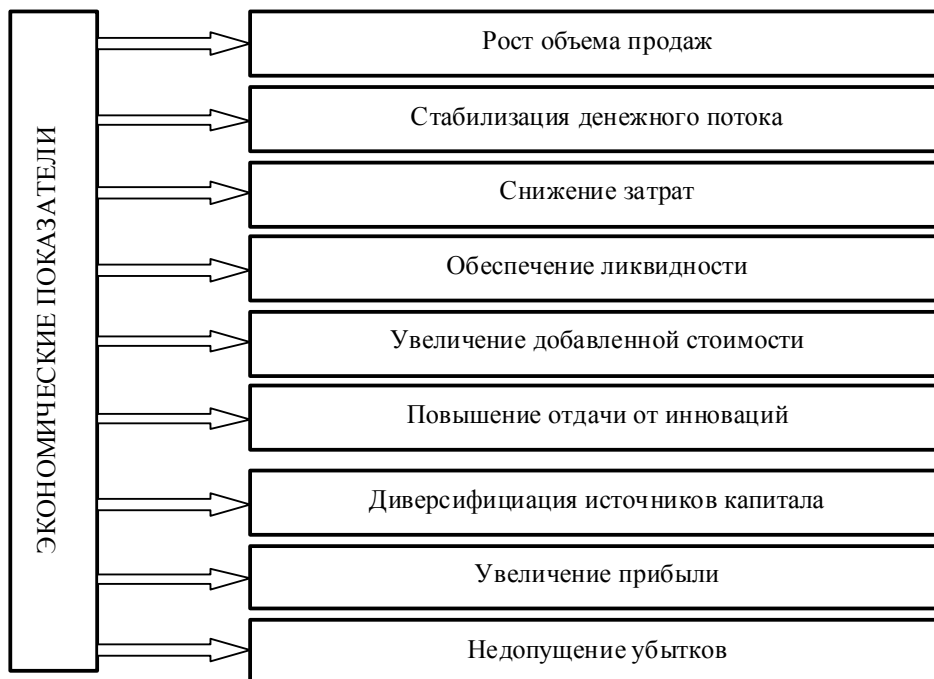
Рис. 2. Сбалансированная система экономических показателей для промышленных предприятий

в макроэкономической сфере, что проявилось в наметившемся росте запасов продукции.