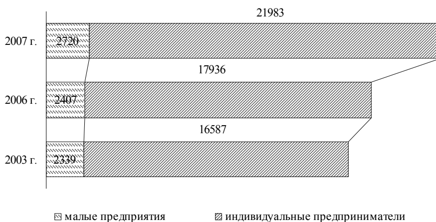
Рис. 1. Динамика роста числа субъектов малого предпринимательства

Малый бизнес в Кабардино-Балкарской Республике (КБР) развивается динамично и превышает среднероссийские темпы роста количества малых предприятий (рис. 1). По состоянию на