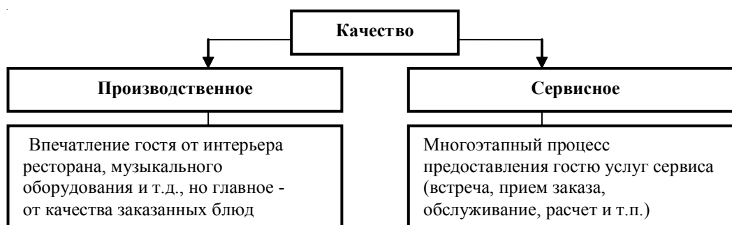
Рис. 1. Составляющие общего качества ресторанный продукта

Рассматривая производственную и сервисную составляющие оценки качества предоставления услуги в ресторане, можно констатировать, что сервисная составляющая имеет, как это, на первый взгляд, ни парадоксально, преимущество над производственной. Нужно учитывать, что человеческий фактор, обеспечивающий сервисную составляющую услуги, выходит на первое место.