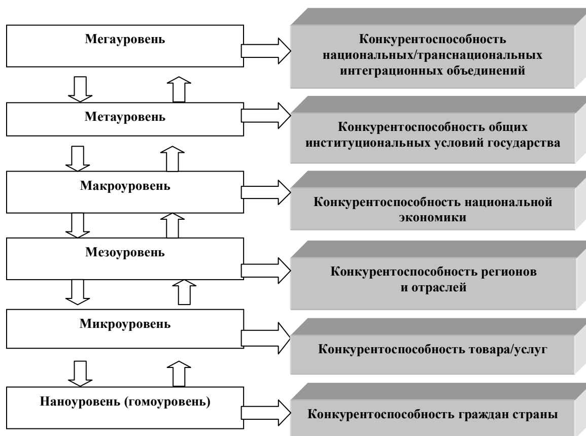
Рис. 2. Иерархическая структура конкурентоспособности

основополагающего для России и ее регионов. Как неотъемлемая часть целостной системы конкурентоспособности, наноуровень, формируя качество и количество человеческих ресурсов государства (его регионов, территорий), характеризует конкурентоспособность отдельных индивидуумов, их пригодность по профессиональным, интеллектуальным, психологическим, медицинским, культурным и иным параметрам для конкурентной борьбы. Действительно, размышляя о “природе и сущности человека”, К. Маркс утверждал: “Человек - базис всей человеческой деятельности и всех человеческих отношений... История не что иное, как деятельность преследующего свои цели человека” 7 .