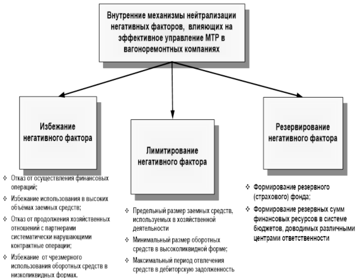
Рис. 1. Внутренние механизмы нейтрализации негативных факторов, влияющих на эффективное управление МТР в вагоноремонтных компаниях