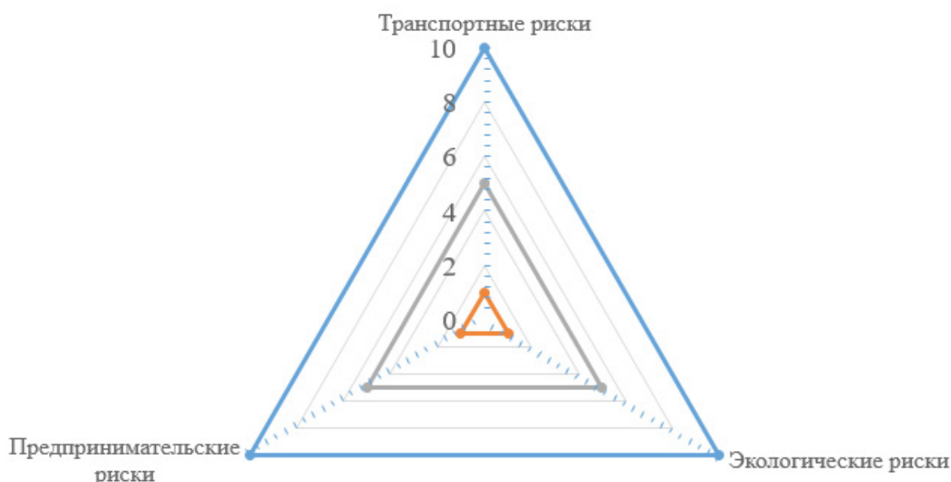
Рис. 1 Треугольник логистических рисков