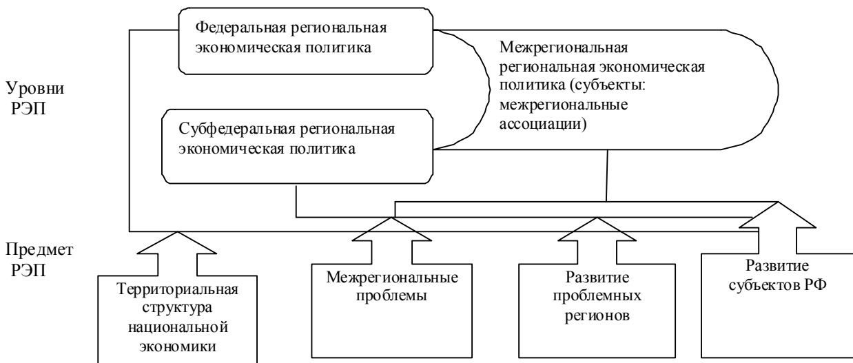
Рис. 1. Уровни и предметы государственной региональной экономической политики

Государственная региональная экономическая политика имеет два уровня: федеральный и субфедеральный (рис. 1).