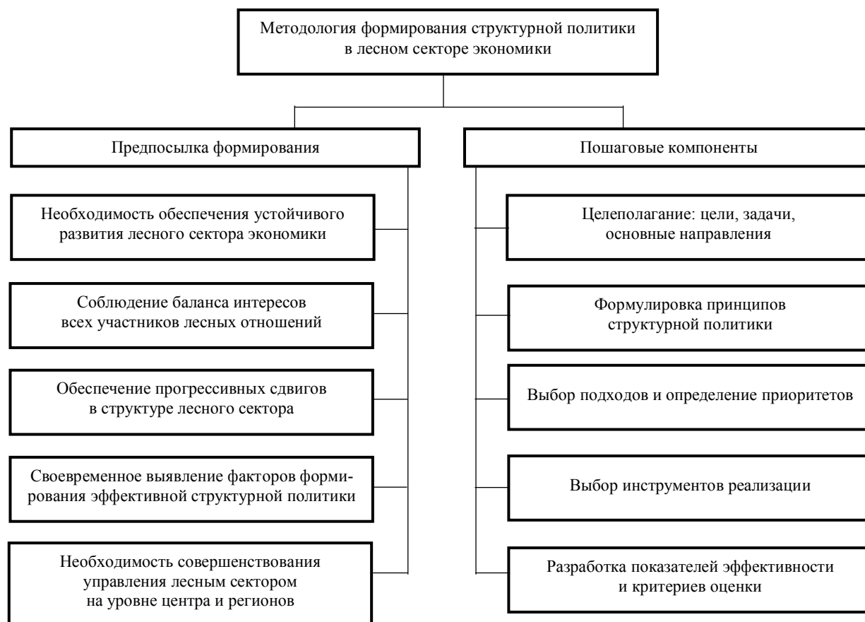
Рис. 2. Методология структурной политики в лесном секторе

2. Цели, связанные с использованием лесных ресурсов: эффективное, многоцелевое, рациональ-