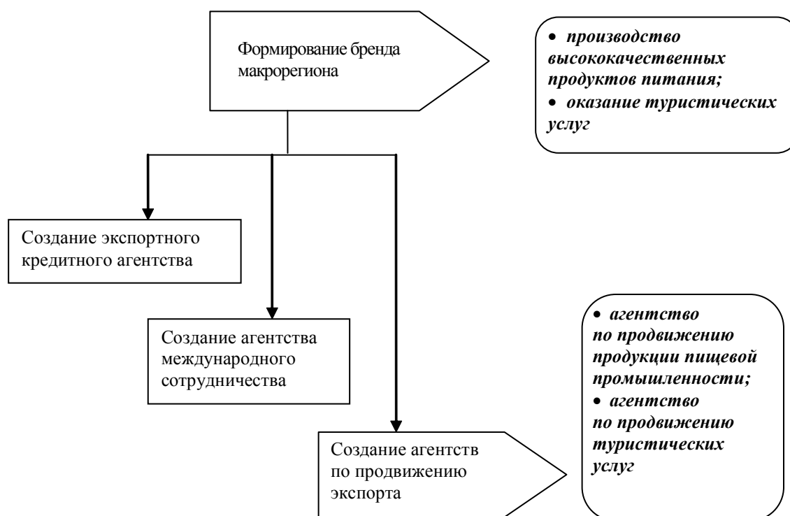
Рис. Институциональная инфраструктура поддержки экспорта в Северо-Кавказском федеральном округе

ственных параметров экономического развития регионов, однако в этой связи государство не должно самоустраняться из данной сферы.