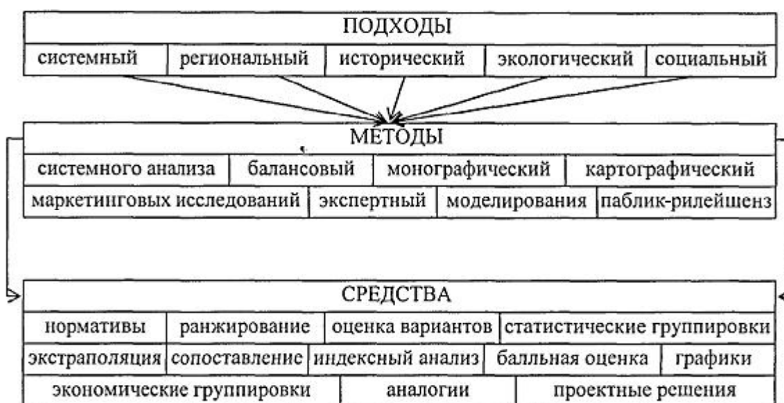
Рис. 2. Схема подходов, методов и средств разработки и научного обоснования целевых программ

Множественность факторов и различная степень их влияния на процесс принятия решений создают предпосылки для вариации путей достижения программных целей. В результате возникает необходимость их технико-экономического обоснования и выбора из альтернативных вариантов реализации программы 3 . Для получения количественных и качественных оценок перспек-