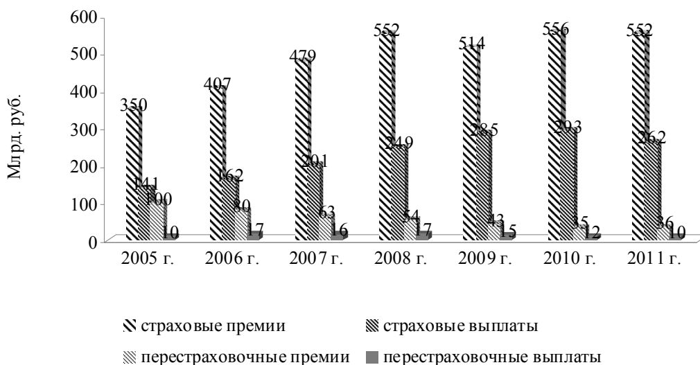
Рис. 3. Динамика страхового и перестраховочного рынка

По данным компании Swiss Re, сектор перестрахования в России развивается так, как и в других восточноевропейских странах, но развит меньше, чем на Западе (рис. 4).