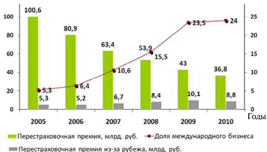
Рис. 4. Международный сегмент перестраховочной защиты

При доле в ВВП 8-10 % для промышленно развитых стран страховой рынок в России едва достиг уровня 2,32 %. При существующих темпах его развития уровень 5 % от ВВП (как в странах Центральной и Восточной Европы) в лучшем случае будет достигнут только через 5-7 лет. В