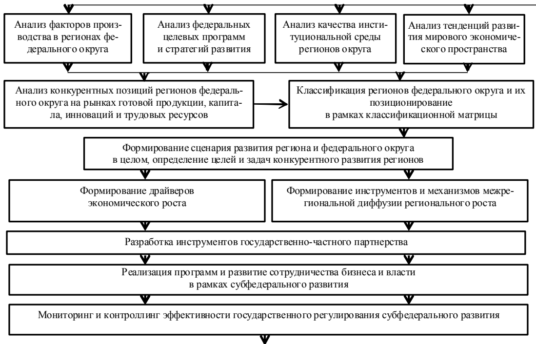
Рис. 1. Процедура формирования и реализации государственной субфедеральной регулятивной политики