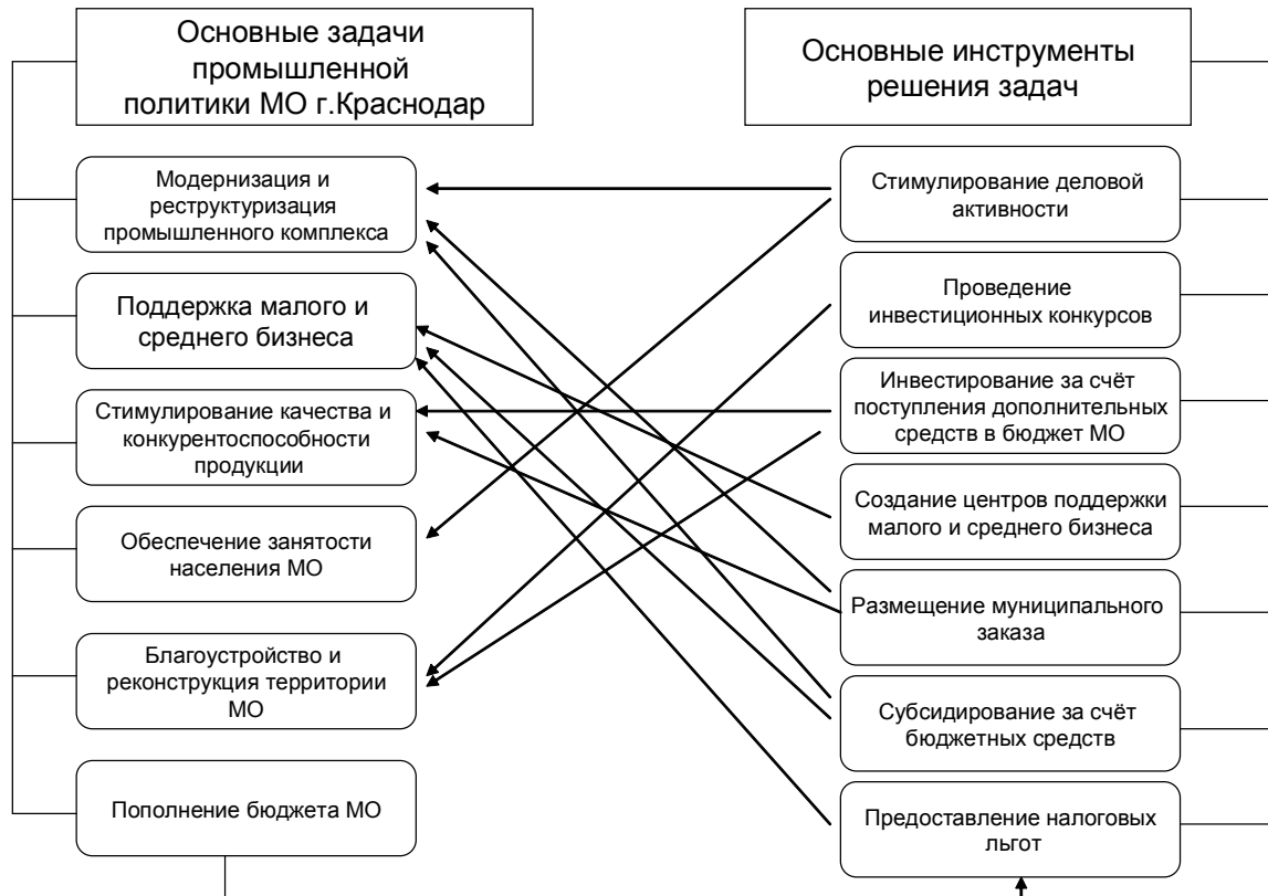
Рис. 2. Механизм решения основных задач промышленной политики МО г. Краснодар

сферы задач как прямо, так и опосредованно. Так, задачи в области стабилизации промышленного комплекса решаются посредством стимулирования деловой активности, субсидирования из бюджетных средств, а также через размещение среди предприятий комплекса муниципального заказа. В то же время стимулирование деловой активности оказывает свое положительное влияние и на повышение уровня занятости населения через увеличение количества рабочих мест. Субсидирование за счет бюджетных средств применяется также в рамках реализации программы по поддержке малого и среднего бизнеса. Помимо этого, в рамках данной программы создаются специальные центры поддержки предпринимательства, о которых было упомянуто ранее, и предоставляются налоговые льготы.