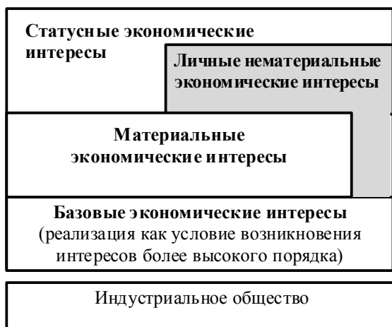
Рис. 1. Структура личных экономических интересов индивида в условиях индустриальной экономики

В период становления рыночной экономики доминирующей формой реализации личных экономических интересов выступают, прежде всего, денежные доходы в различных формах, а основным способом реализации личных экономических интересов служит экономическая деятельность, осуществляемая на принципах возмездности и эквивалентности. На данном этапе происходит усложнение структуры личных экономических интересов, обусловленное социальным обособлением и дифференциацией личных интересов индивидов. Общественное разделение труда, его специализация и кооперация формируют основы для социальной структуры общества, фундамент иерархии которой