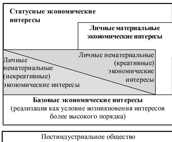
Рис. 2. Структура личных экономических интересов индивида в условиях постиндустриальной экономики

Как следствие, высокий уровень самостоятельности, пространственной мобильности, наличие способности к осуществлению независимой деятельности определяют характер реализации личных экономических интересов индиви-