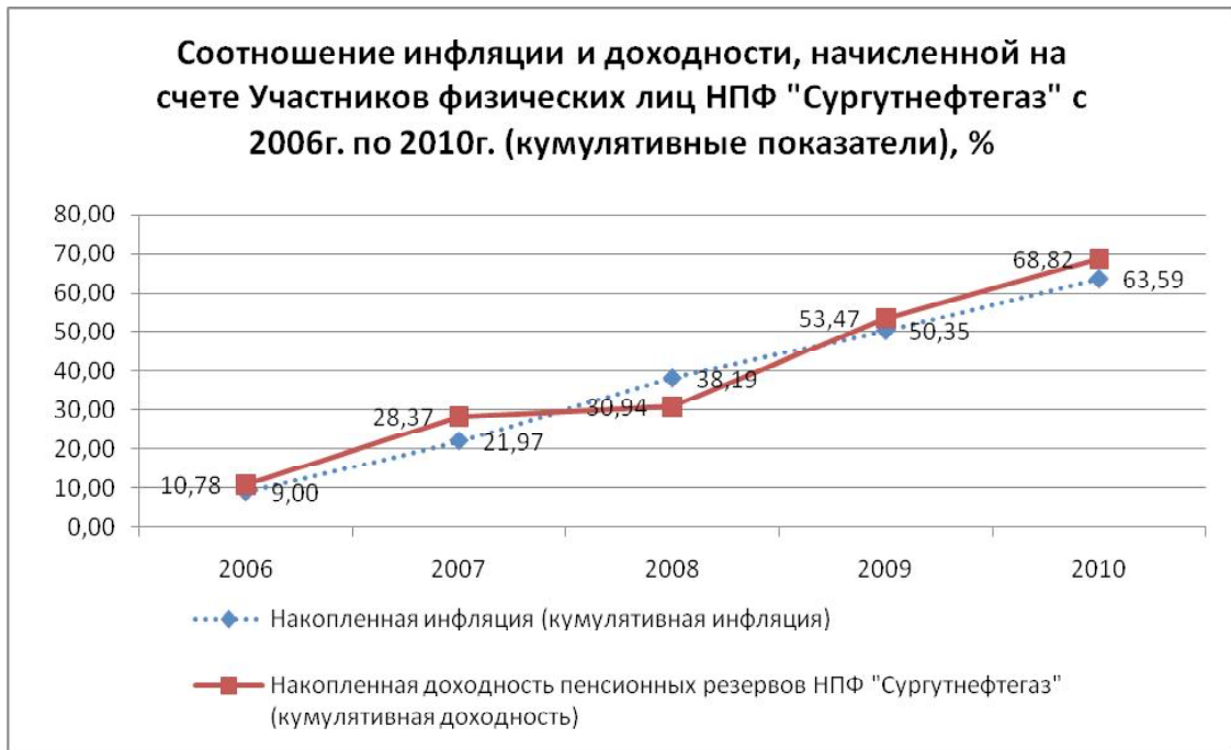
Рис. 1. Динамика кумулятивных показателей соотношения инфляции и доходности за 2006-2010 гг.